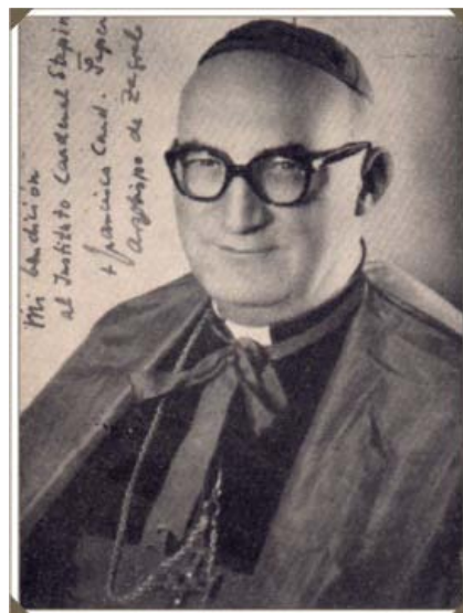
FRANJO ŠEPER (1905-1981) CARDENAL DE ORIGEN CROATA DE LA IGLESIA CATÓLICA Y PREFECTO DE LA CONGREGACIÓN PARA LA DOCTRINA DE LA FE

Curadas esas viejas heridas, lo cierto es que mediante un documento fechado el 19 de julio de 1974 por el cardenal Seper , prefecto de la Congregación para la Doctrina de la Fe, por primera vez desde la excomunión de 1738, la Santa Sede admitía públicamente la existencia de masonerías exentas de contenido contrario a la Iglesia y, por lo tanto, sobre las que su pertenencia no llevaba consigo la pena de excomunión. Dicho de otra forma, se reconocía que la excomunión lanzada hacía dos siglos tenía su explicación en un contexto de problemas políticos y de luchas