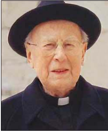
FRANZ KÖNIG (1905-2004), ARZOBISPO DE VIENNA Y CARDENAL DE LA IGLESIA CATÓLICA

4º) A raíz del nuevo Código de Derecho Canónico se pone de relieve el interés de un sector fundamentalista de la Iglesia católica empeñado en seguir condenando a la masonería con la pena de excomunión. Frente a gran número de Conferencias Episcopales manifestadas a favor del levantamiento de la condena, la única que adopta una posición contraria, en 1980, es la alemana. Esta presión sigue hasta la última reunión en Roma de la Comisión preparatoria del nuevo Código de Derecho Canónico, en la que sometida la cuestión a votación la tesis alemana fue derrotada en la Congregación Plenaria de 1981, ya que de 59 miembros sólo votaron 13 a favor de las tesis condenatorias alemanas, siendo 31 los que votaron en contra, entre ellos el cardenal König que un año antes también se negó a firmar la declaración de la