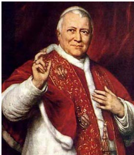
PAPA PIO IX

La Iglesia Católica ha condenado sistemáticamente la filiación a la masonería en innumerables documentos, decretando que esta es incompatible por sus principios