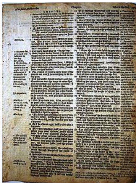
Biblia de Génova, una de las principales traducciones de la Biblia al inglés por parte del movimiento protestante del siglo XVI. En la imagen, el Padre nuestro en el evangelio de Lucas .