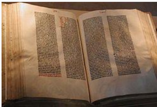
Biblia de Gutenberg (Maguncia, siglo XV) .

Género Religión , parábola , Profecía , Epístola , poesía , derecho y sabiduría