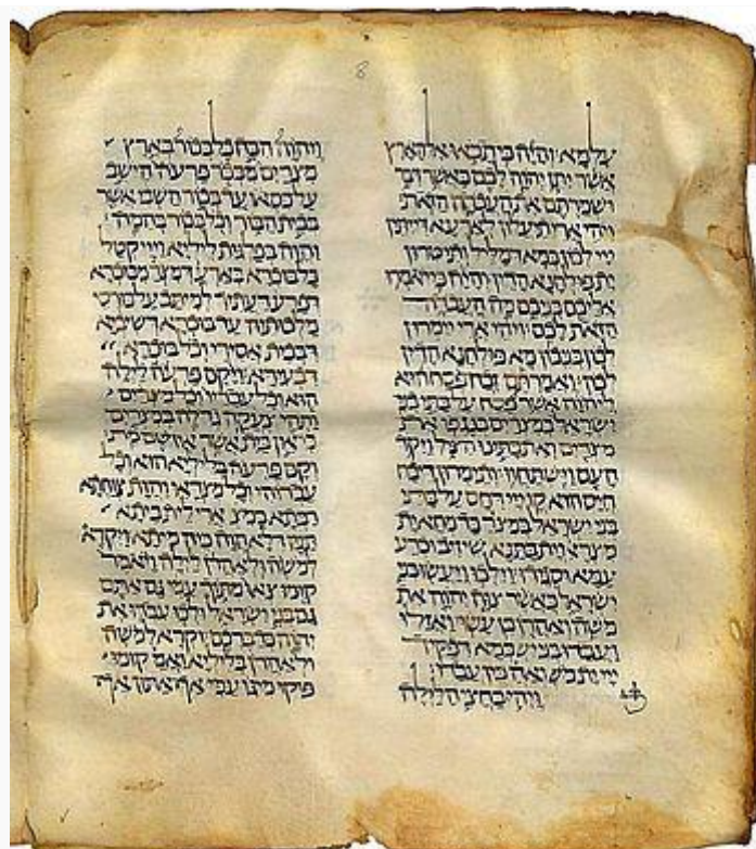
MS 206 Hebrew square book script. Iraq, 1st half of 11th c.

Biblia hebrea con tárgum en arameo, manuscrito del siglo XI. Presenta el texto de Éxodo 12:25-31 en caracteres hebreos .